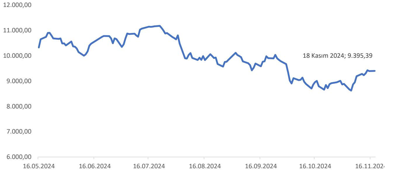
Grafik 2: BİST 100 Endeksi

Altınay Savunma Teknolojileri A.Ş. paylarının Borsa İstanbul'da işlem görmeye başladığı tarihten itibaren BİST 100 endeksinin gelişimi aşağıda sunulmaktadır: