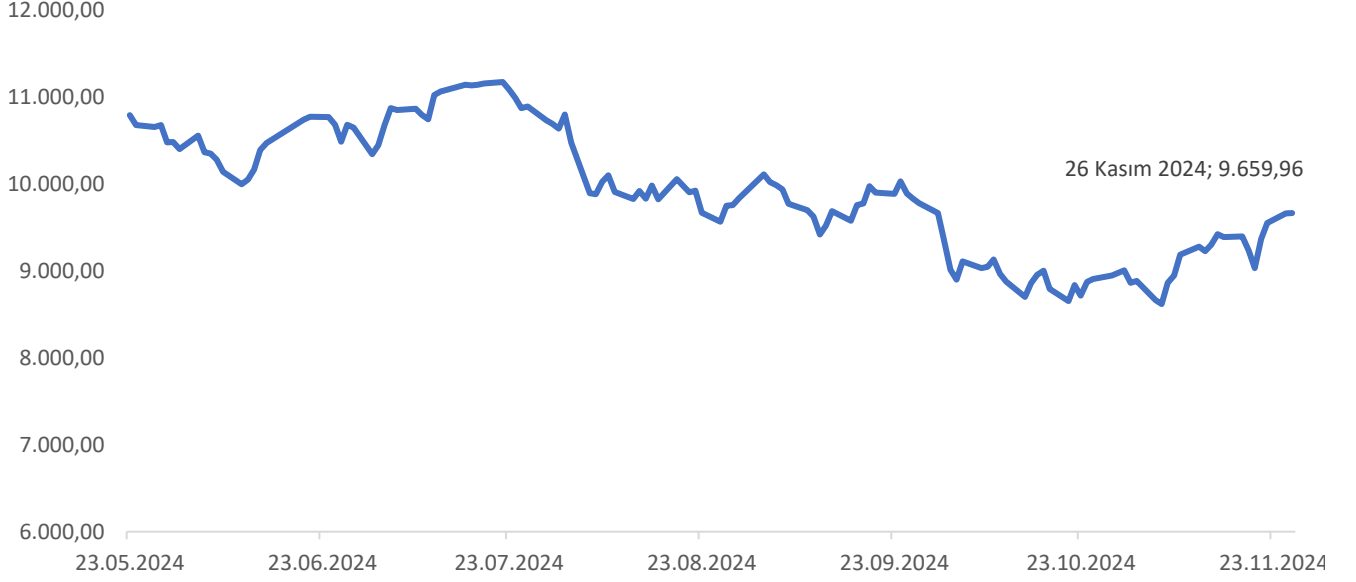
Grafik 2: BIST 100 Endeksi

Hareket Proje Taşımacılığı ve Yük Mühendisliği A.Ş. paylarının Borsa İstanbul'da işlem görmeye başladığı tarihten itibaren BIST 100 endeksinin gelişimi aşağıda sunulmaktadır: