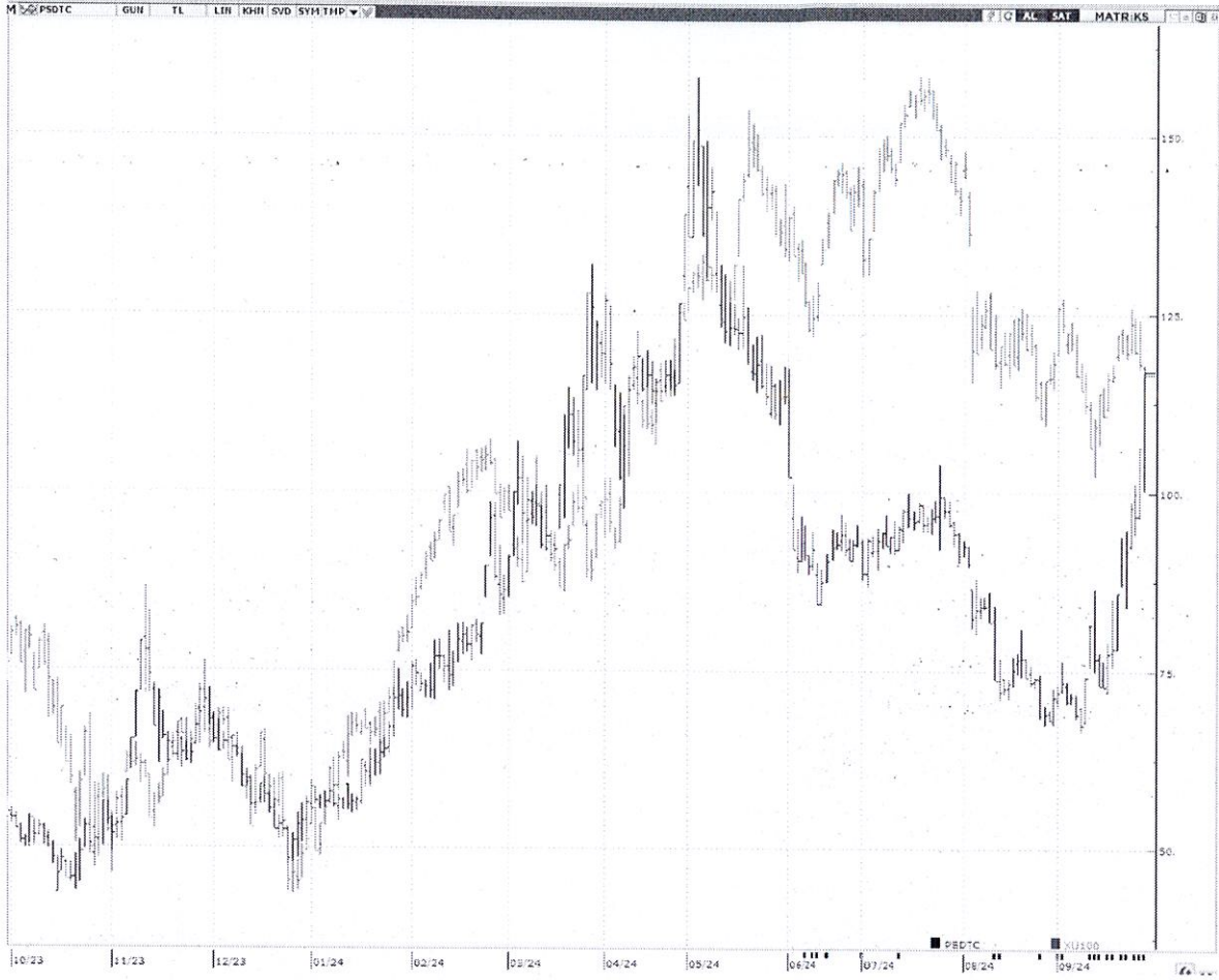
Matriks Bilgi Dağıtım Hizmetleri A.Ş PSDTC / XU100 Karşılaştırmalı Grafik