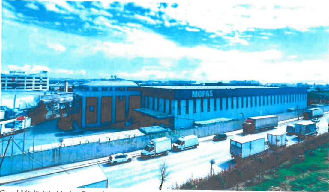
Genel Müdürlük, Merkez Depo dış görünümü

Şirket, operasyonları kapsamında 1 genel müdürlük ve 1 merkez depoya ek olarak 3 adet dağıtım merkezine sahiptir. Bu dağıtım merkezleri toplamda 30.000 m 2 lik bir depo alanını içermektedir.