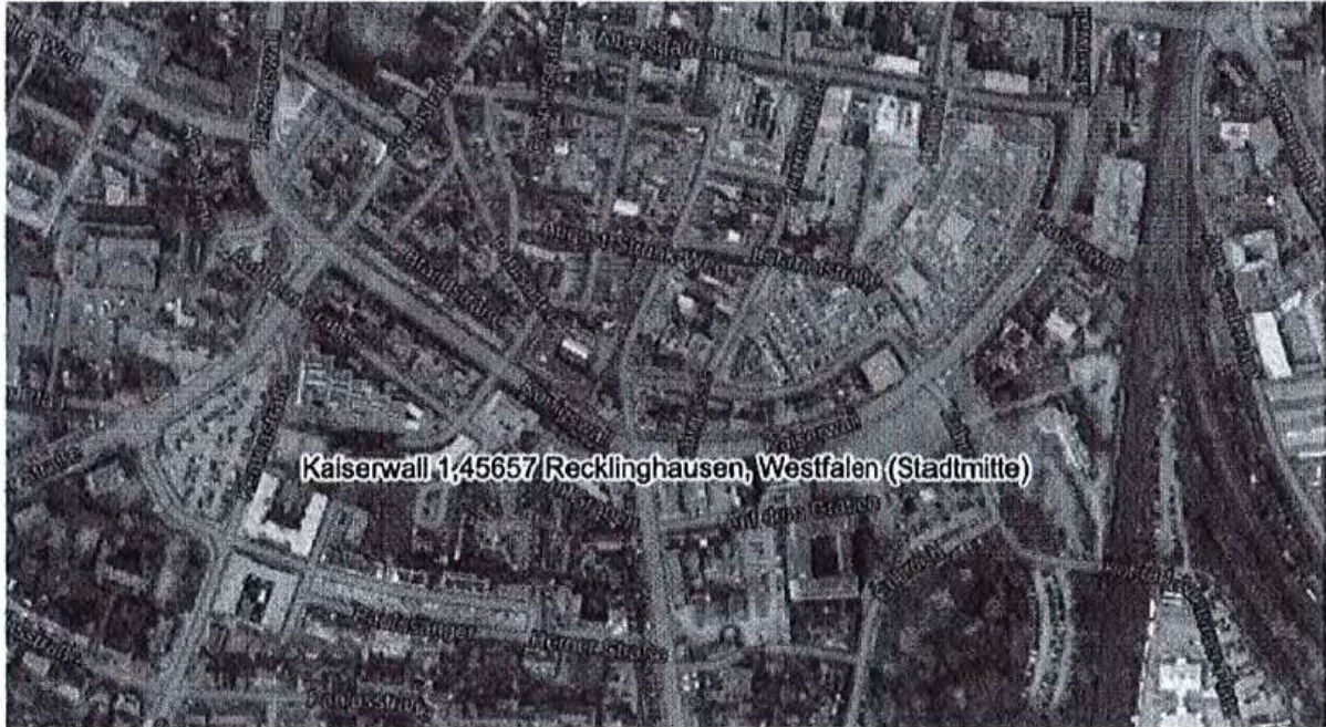
Havadan fotoğraf (ölçeksiz)

Mevcut kullanım için, mikro konum genel olarak iyi olarak değerlendirilir.